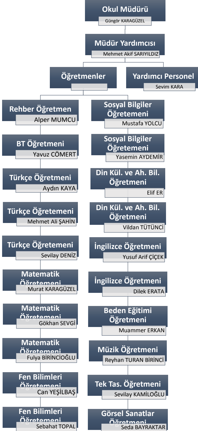
Şekil 2: Teşkilat Yapısı