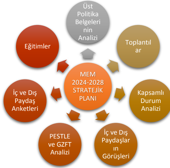
Şekil 1. Stratejik Plan Hazırlık Aşamaları

Stratejik plan hazırlık çalışmalarının başladığı kurumumuzda Genelge kapsamında Stratejik Planlama Ekibi oluşturulmuş ve planın sahiplenilmesi sağlanmıştır. Hazırlık döneminde planın tüm birimlerce sahiplenilmesi, planlama sürecinin organizasyonu, ihtiyaçların tespiti, zaman planlaması gibi unsurlar ve durum analizinin yöntemleri ile geleceğe bakış kısmını oluşturan misyon, vizyon ve temel değerler kavramları gibi ana hatlar yer almaktadır. Osman Tan Ortaokulu Müdürlüğümüz 2024–2028 Stratejik Planı; literatür taraması, toplantılar, kapsamlı durum analizi raporu (üst politika belgelerinin analizi, mevzuat analizi, faaliyet alanları ile ürün ve hizmetlerin belirlenmesi, PESTLE ve GZFT analizleri, uygulanmakta olan stratejik planın değerlendirilmesi, iç ve dış paydaşların görüşlerinin alınması, kuruluş içi analiz ile tespit ve ihtiyaçların belirlenmesi) doğrultusunda hazırlanmıştır.